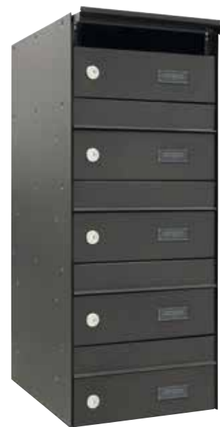
Batería 5 buzones / U10154 NEGRO