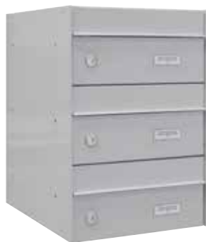
Batería 3 buzones / U1032 PLATA