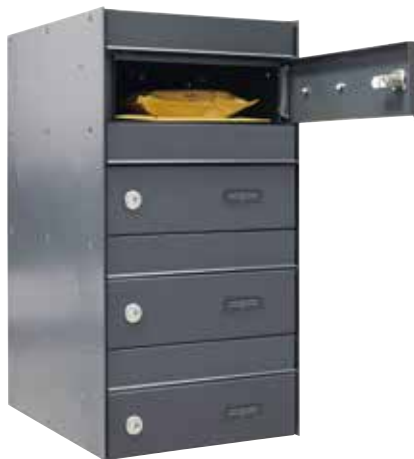
Batería 4 buzones / U1046 ANTRACITA