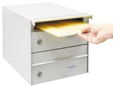
Batería 2 buzones / U1021 BLANCO