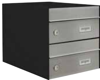
Batería 2 buzones / U1025 Cuerpo NEGRO y frente INOXIDABLE SATINADO